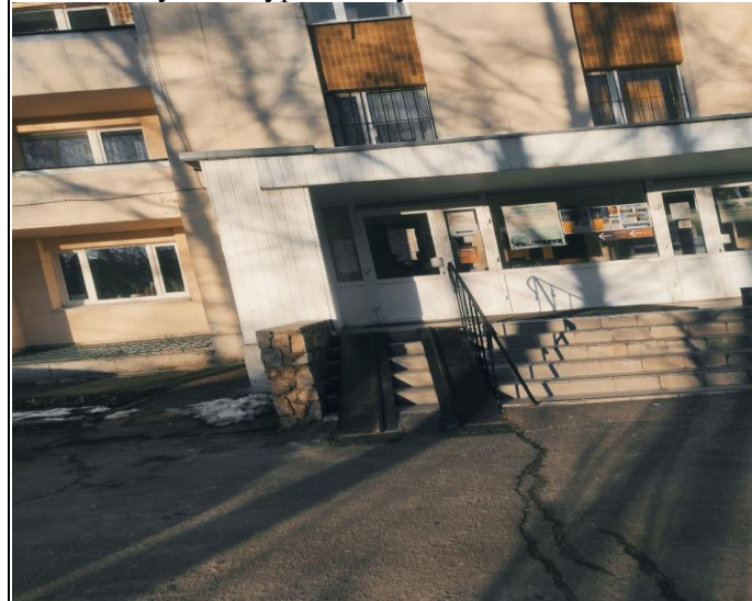
Фото пандуса до гуртожитку № 3:

Вдячні експертам за обґрунтовані спостереження та рекомендації, які будуть обговорені та враховані у ході практичного втілення освітньої програми. Разом із тим, вважаємо за необхідне додати, що гуртожиток № 3 має один із входів, обладнаний пандусом. Усі гуртожитки мають функціонуючі ліфти, тож у разі потреби поселення маломобільних здобувачів може здійснюватися саме до цього гуртожитку.