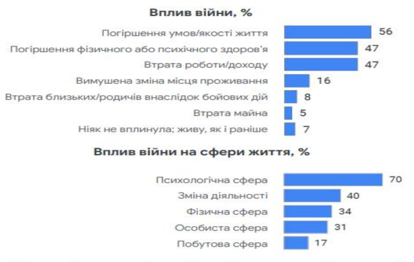
Рис. 1. Вплив воєнної агресії на різні сфери життя українських споживачів

Таким чином, спостерігається істотний вплив воєнної агресії на різні сфери життя українських споживачів (рис.1):